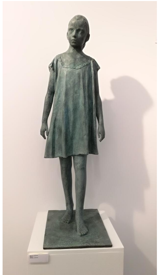
Pedro Quesada "Lola" Bronce – 90x30x30