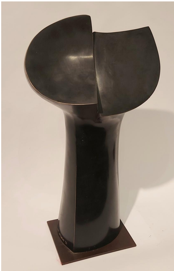
José Luis Sánchez - "Germen" Bronze – 48x20x20