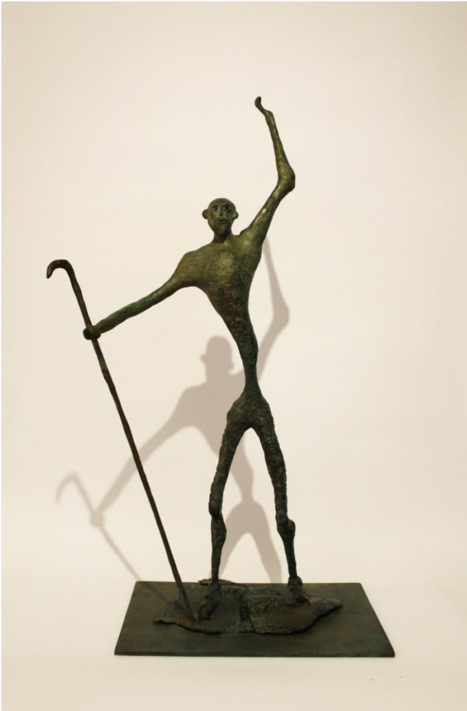
Jorge Lencero "El Profeta" Bronce 75x36x23