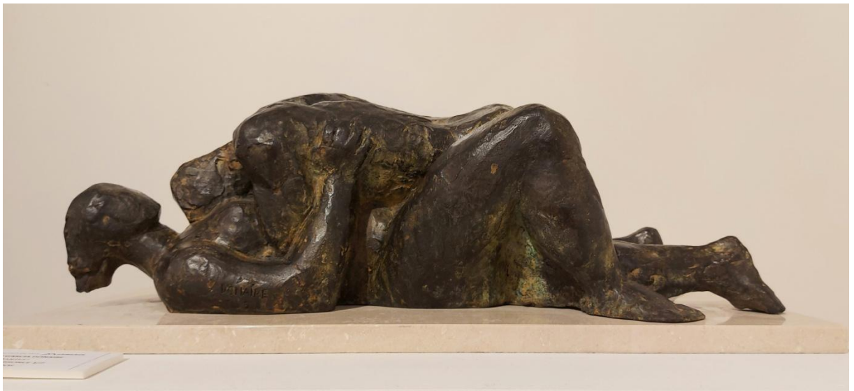
Joaquín García Donaire "Amantes" – Bronce - 58x26x19,5