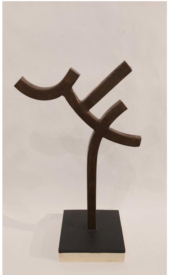
J.M. Municio Hierro I, 52x31x2.5