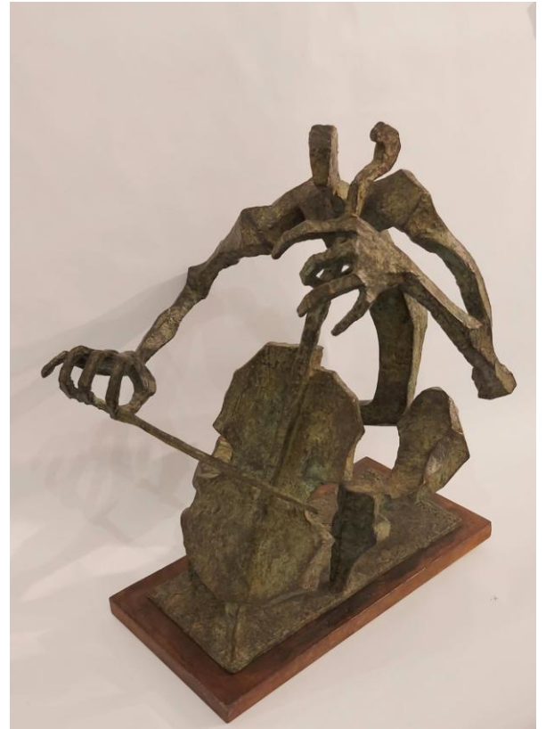
Ángel Florez "Violonchelista" - Bronce 43x40x33