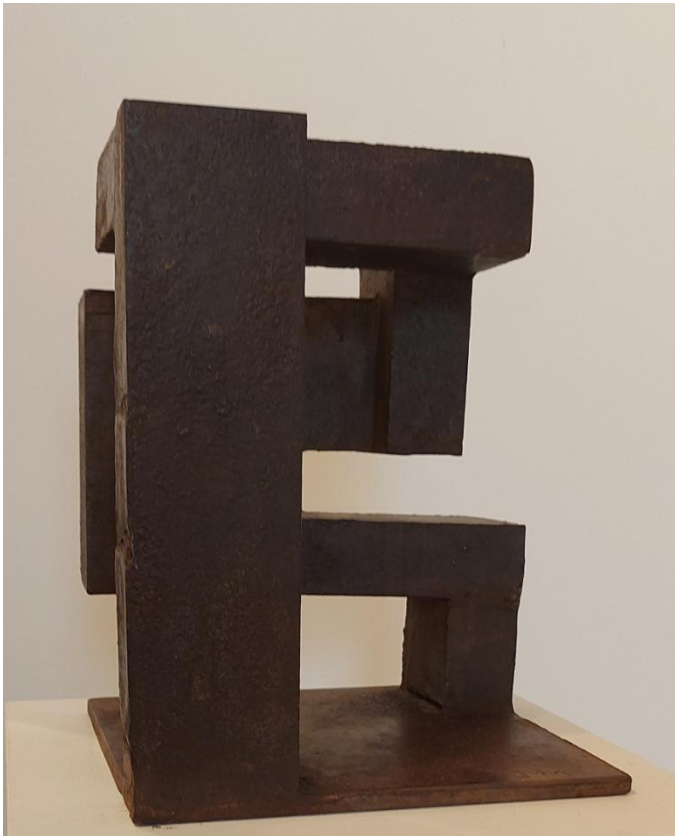
J.M. Municio Hierro II, 26x24x31