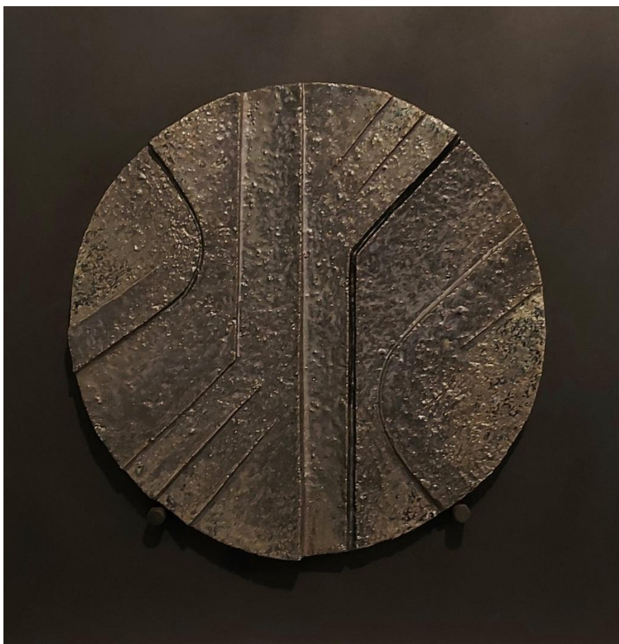
Enric Mestre - "Escultura circular" Cerámica esmaltada - 34,5