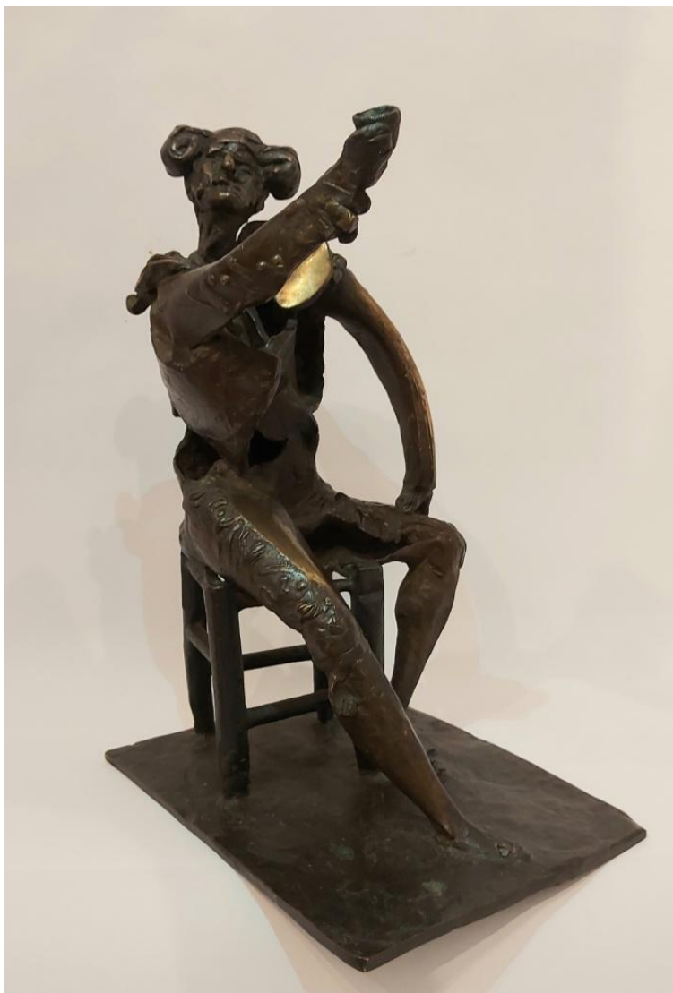
Javier Clavo – “El mellao” Bronce 34x24x19