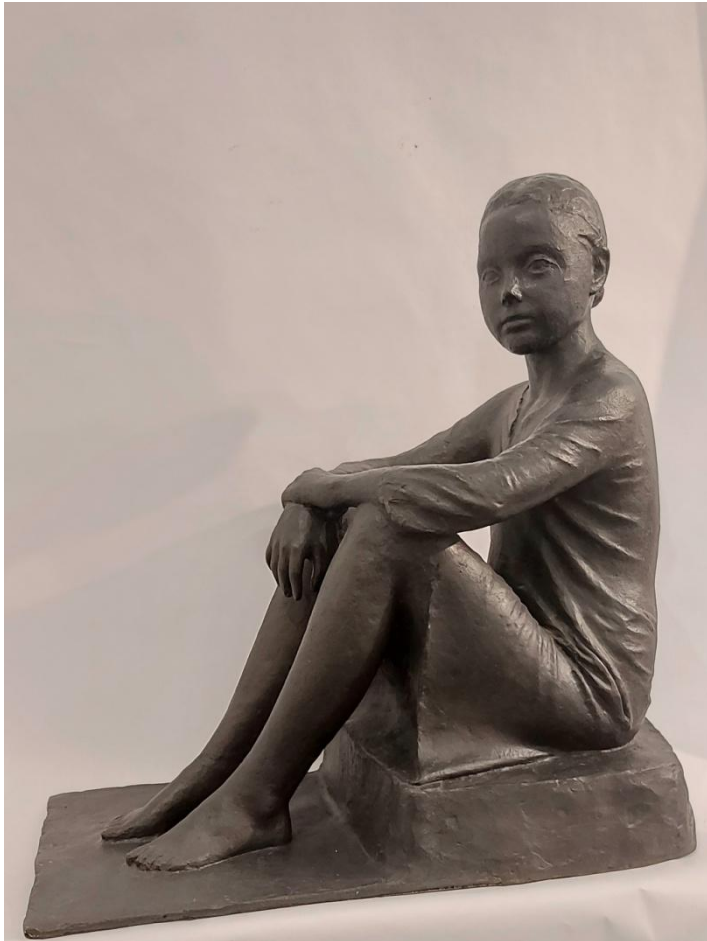
Pedro Quesada "Figura sentada" Bronce – 54x54x28