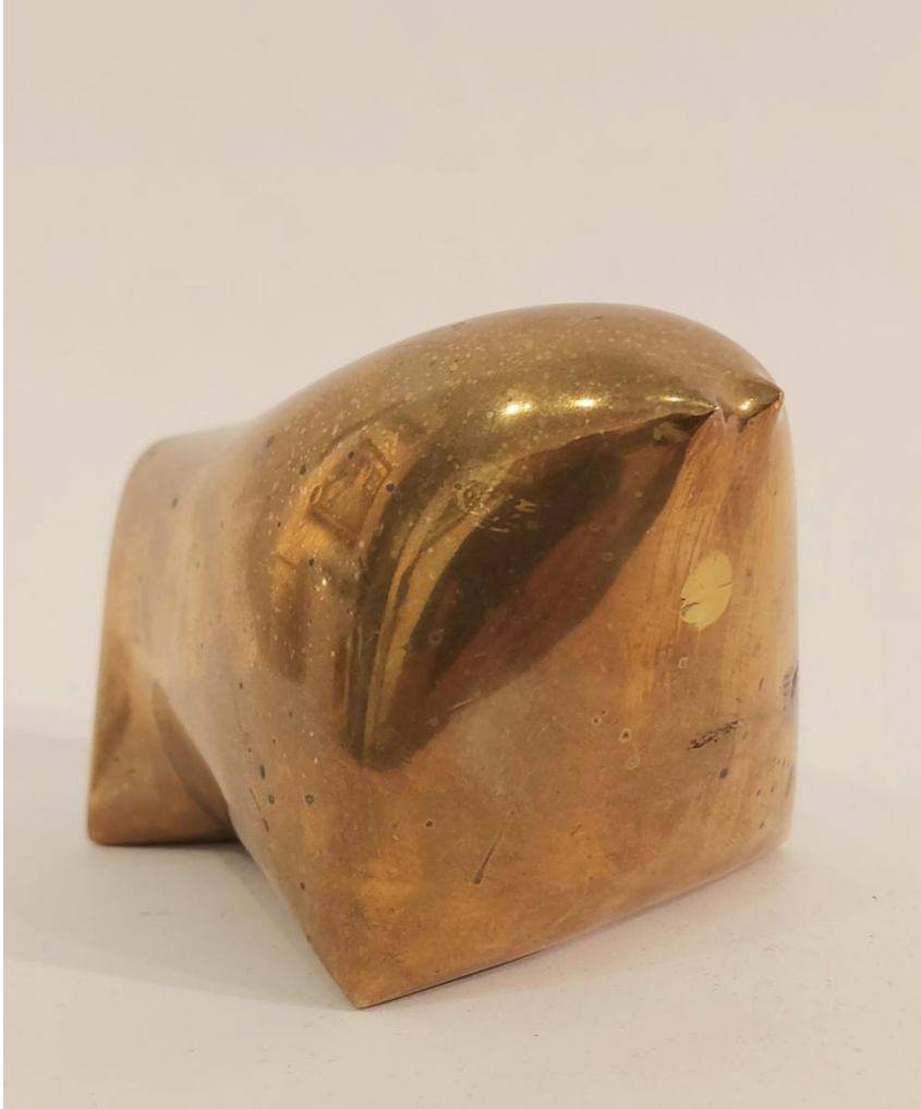
Pablo Serrano - "Toro" Bronze – 13x9x8.5