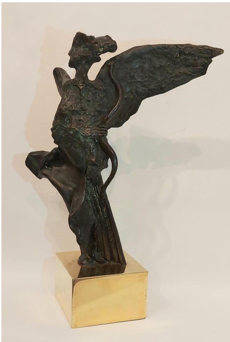
Oscar Estruga "Icaronauta" - Bronze - 43x32x19