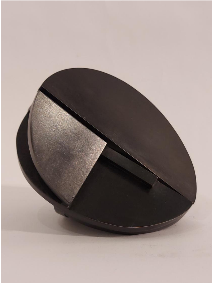
Rafael Canogar - "Castilla I" Bronze patinado - 12x13x14